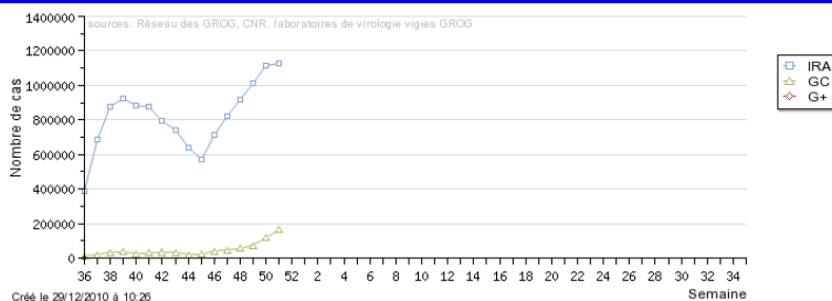
Estimations du nombre de consultations pour Infection Respiratoire Aiguë (IRA), grippe clinique (GC) et grippe confirmée virologiquement (G+) en France, médecine générale et pédiatrie - Saison 2010-2011