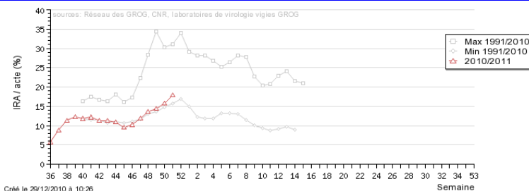
Infections Respiratoires Aiguës (IRA) en médecine générale - Saison 2010-2011 comparé aux minima et maxima observés à la même semaine depuis 1991